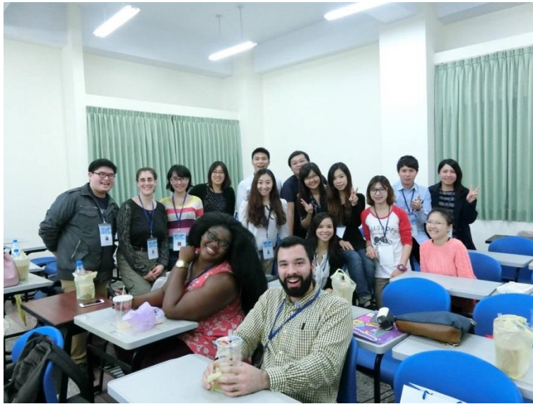
【衛生管理實務課程學生合照】2016/1/7